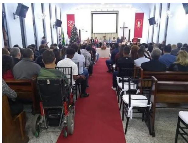
Cerimônia de lançamento das revistas Coepta no Colégio Luterano

Para celebrar a publicação de cada revista, temos promovido cerimônias de lançamento no Colégio Luterano, seguidas de um coquetel de confraternização. Esses festejos não só marcam o sucesso dos alunos que tiveram seus trabalhos aprovados, como também permitem o compartilhamento dessa conquista com seus familiares e professores.