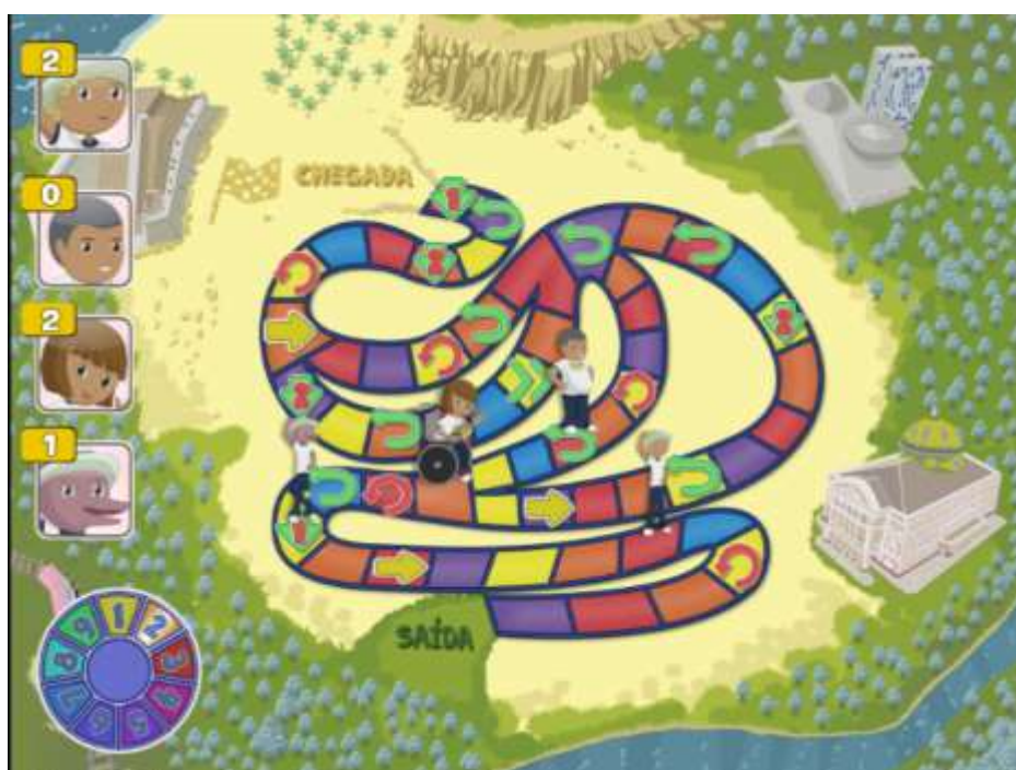
Figura 1 - Plataforma do Game Qual é o problema? (Programa Cultura Escrita)

Valendo-se desse potencial pedagógico (e, no caso, também como instrumento de investigação de concepções infantis), o Game “Qual é o Problema?” (Programa Cultura Escrita) configura-se como uma plataforma de 50 situações de conflito relativas ao tema (17 especificamente para o eixo “Gênero, Configurações e Portadores, Textuais”), disponíveis de modo randômico em um percurso de 43 casas. Ao acionarem uma roleta com números de 1 a 9, as 30 crianças pesquisadas, jogando em duplas, só poderiam avançar mediante a resolução do problema (ou encaminhamento da situação) indicado em cada casa. Ao longo do percurso, poderiam também encontrar outras orientações como avançar ou retroceder casas, perder problemas acumulados e escolher quem deve receber problemas a mais. A Figura 1 apresenta a tela do jogo, com a roleta e o dispositivo para consultar o “varal de problemas acumulados” à esquerda da imagem: