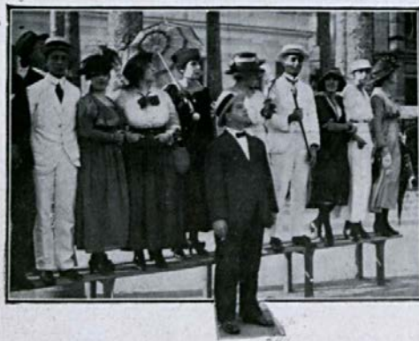
Apreciando o jogo

Uma página da revista “Caretta”, de 4-11-1916, é dedicada às torcedoras do Fluminense, fanáticas: