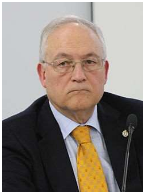
Prof. Fanjúl https://gl.wikipedia.org/wiki/Seraf%C3%ADn_Fanjul

Link: http://www.hottopos.com/collat2/fanjul.htm