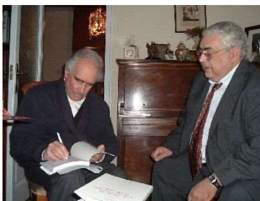
JL com ALQ em sua casa em Madri

Link: http://www.hottopos.com/harvard1/quintas.htm