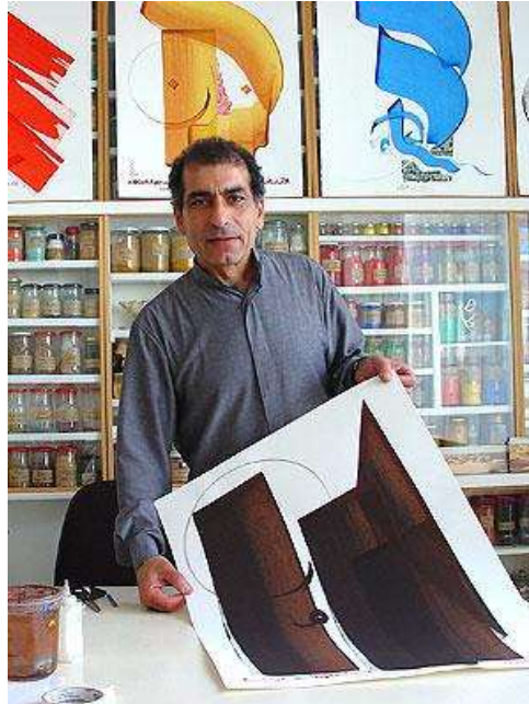
H.M. em seu estúdio em Paris https://www.wikiart.org/pt/hassan-massoudy

Link: http://www.hottopos.com/spcol/HassanMassoudy.pdf