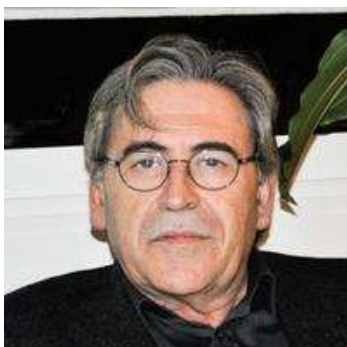
C. Coll - https://www.goodreads.com/author/show/2668467.C_sar_Coll_Salvador

Link: http://www.hottopos.com/harvard1/coll.htm