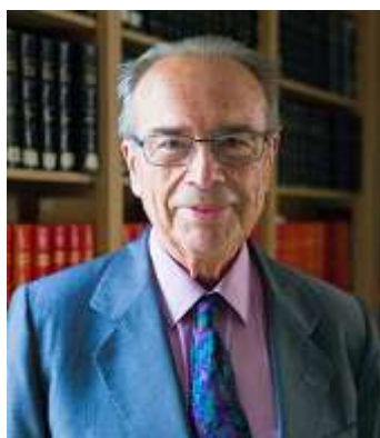
http://www.realacademiadesanquirce.es/jos%C3%A9-antonio-linage-conde.html Dr. Linage – grande especialista espanhol na história beneditina.

Link: http://www.hottopos.com/notand2/linage.htm