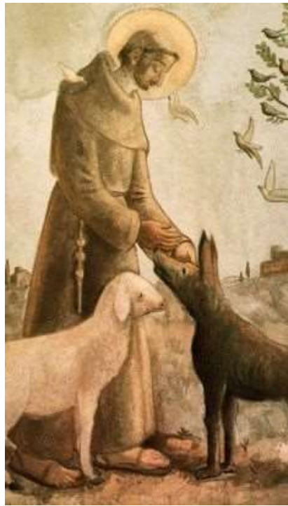
Quadro de Fulvio Pennacchi

https://br.pinterest.com/pin/739857045003487561/