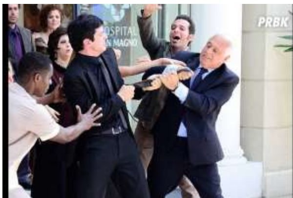
Antônio Fagundes e Mateus Solano – “Amor à Vida” (2014)

Pensar em termos abstratos é uma coisa; outra, bem diferente, é como dizem os ingleses: “ the real thing ”, a hora da verdade. É muito fácil cantar na arquibancada: “Nem teme quem te adora a própria morte”, ou no hino do exército: “Se a pátria amada for um dia ultrajada, lutaremos com valor” (já a clássica paródia, menos idealizada, diz: “Se a pátria amada precisar da macacada, puxa vida que maçada ”).