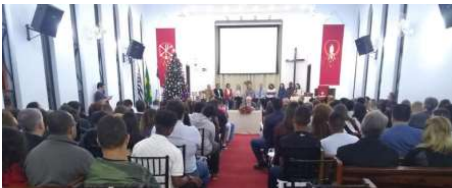
Autores, famílias e orientadores na sessão solene de lançamento das Coepta 3 e 4, no Auditório do Colégio Luterano São Paulo (2-12-2019)