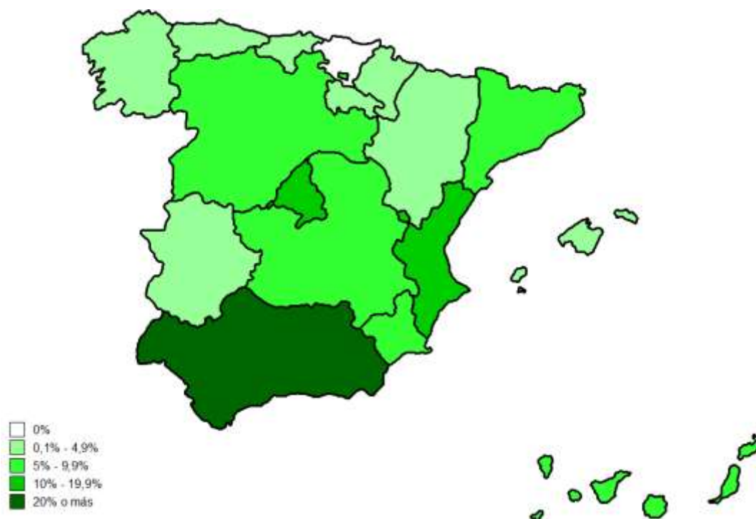
Figura 1 – Mapa de distribución de los votos de VOX por Comunidad Autónoma, últimas elecciones 5

La siguiente figura (Fig. 2) muestra las diferencias de género en la distribución geográfica de los votos a VOX en las últimas elecciones generales del 10 de noviembre de 2019. En términos generales, se observan pocas diferencias a partir de la variable del sexo. La primera diferencia es el mayor número de hombres que votaron a VOX en comparación con el número de mujeres.