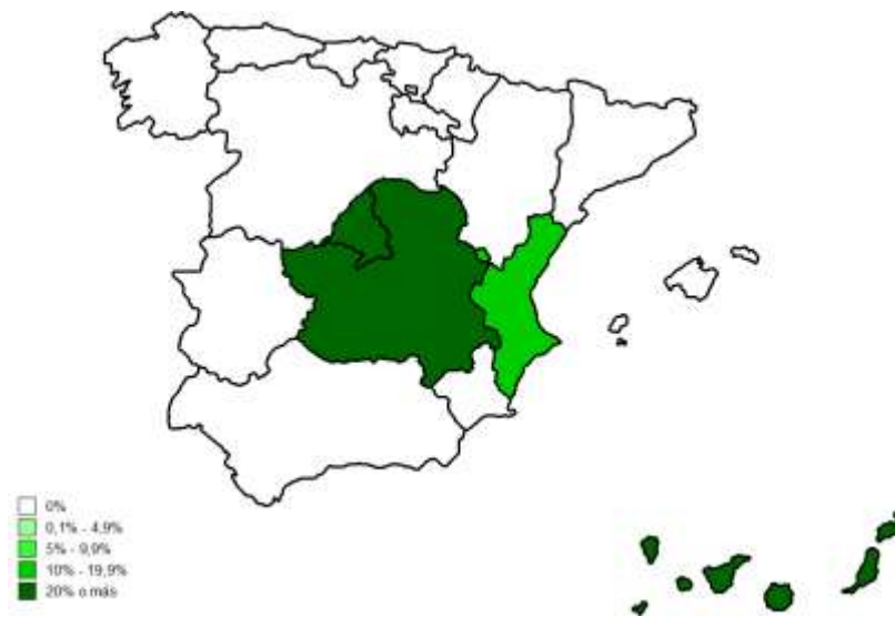
Figura 7 - Mapa de distribución del voto indeciso de VOX por Comunidad Autónoma (en %)