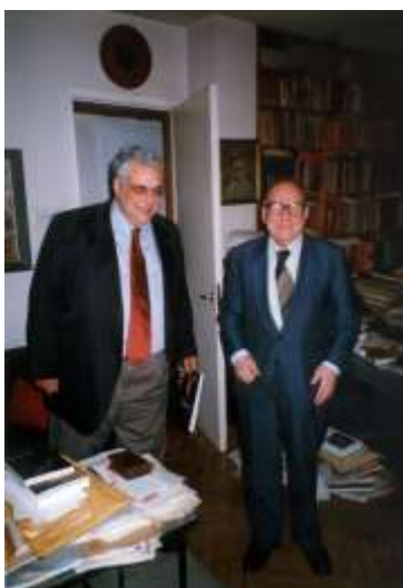
No apartamento de Julián Mariás em Madri

Após gravarmos a entrevista, Don Julián convidou-me para assistir a suas conferências sobre filosofia (ele estava dando dois cursos de conferências). Anotei endereço, datas e fui ao curso “A Espanha possível do século XXI”. Ao chegar ao local (a conferência “ La moralidad colectiva ” era na calle San Bernardo, rua central em Madri), havia uma multidão, mais de 300 pessoas que se apinhavam para assistir a um filósofo, que contava, então, com 84 anos. Mariás era um conferencista incomparável que, quase literalmente, tirava o ar da plateia. Sem nenhuma anotação, sua voz cálida, dava a impressão de estar conversando com cada um, semi-formalmente. Ao final, perguntei sobre a trabalhadeira da preparação e ele respondeu-me que não, que era tudo improvisado. E com o oxímoro: “ una improvisación inmensamente preparada! ”.