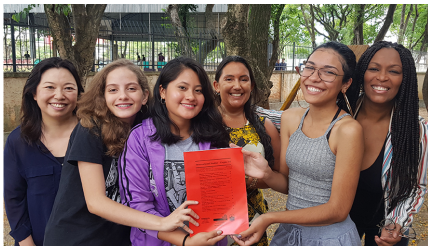
Alunas autoras e professoras orientadoras da EMEFM Vereador Antonio Sampaio.

a postura investigativa como formas de viabilizar aspectos muitas vezes esquecidos pelos programas escolares. Seja pela possibilidade de inovar e ressignificar a intervenção educativa na formação de estudantes, seja pela chance de fortalecer caminhos de motivação, de compartilhamento de estudos e de exploração de sentidos entre os adolescentes, fica o reconhecimento do projeto Coepta - um reconhecimento que valoriza o esforço dos alunos, as iniciativas docentes e, sobretudo, a possibilidade de produção ativa do conhecimento na escola.