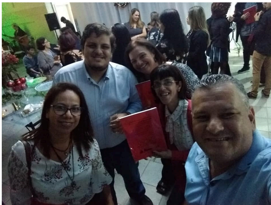
Após a cerimônia de lançamento, um coquetel comemorativo para autores, família e orientadores no salão de festas do Colégio Luterano