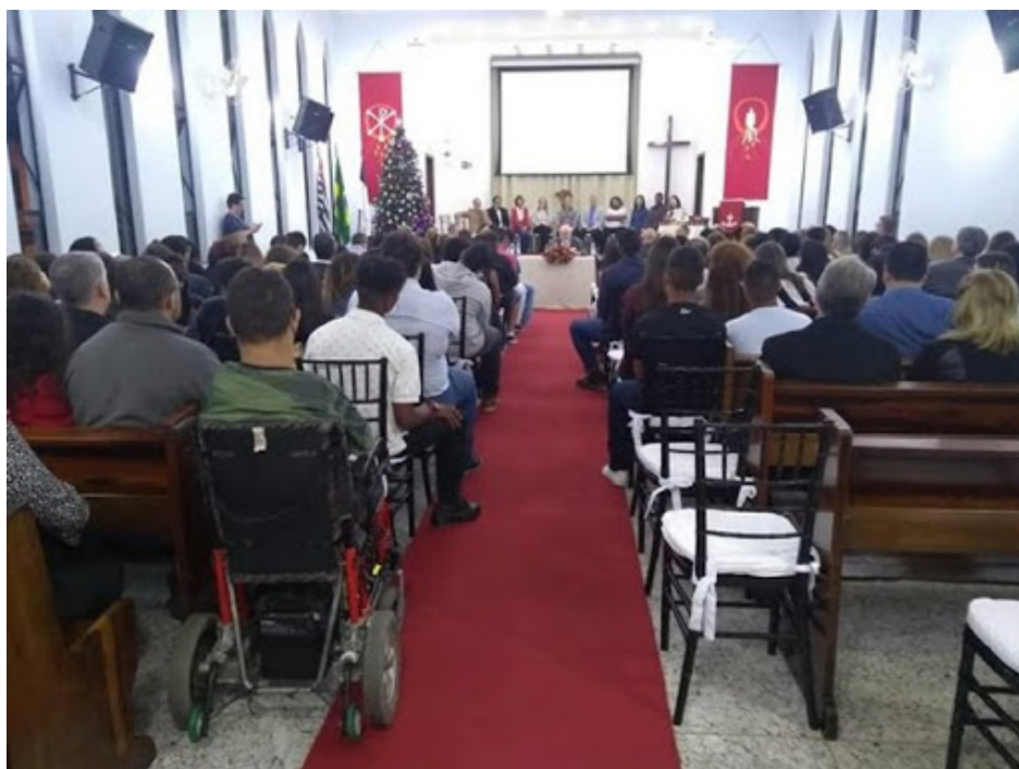
Cerimônia de lançamento das revistas Coepta no Colégio Luterano